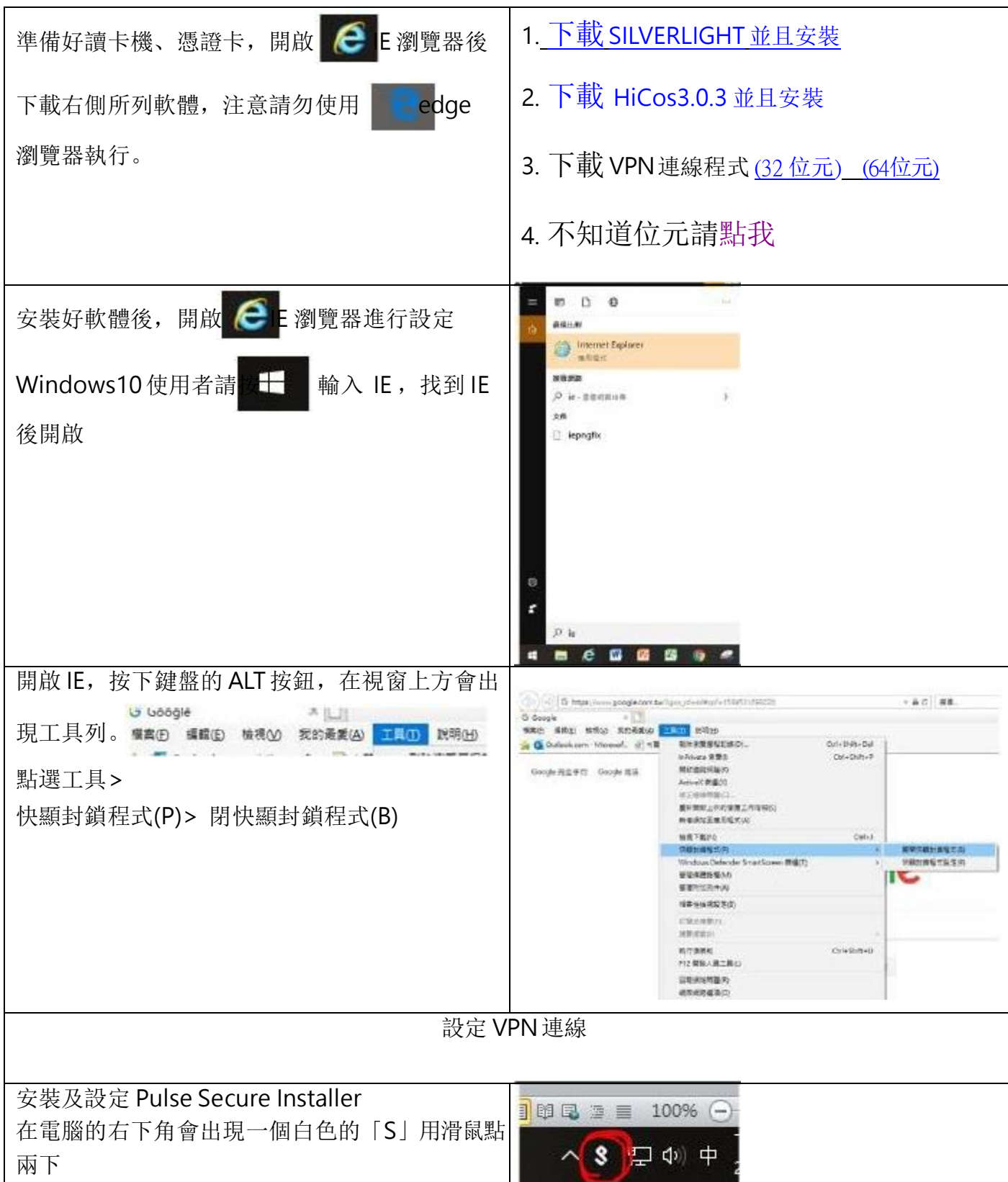
式 (VPN 翻牆)